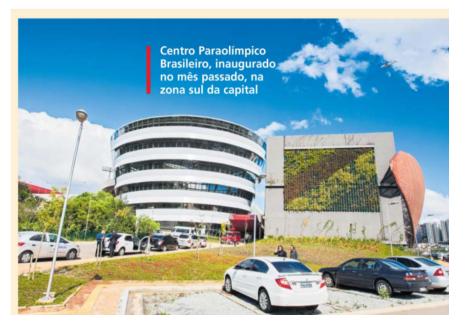
Centro Paraolímpico Brasileiro, inaugurado no mês passado, na zona sul da capital