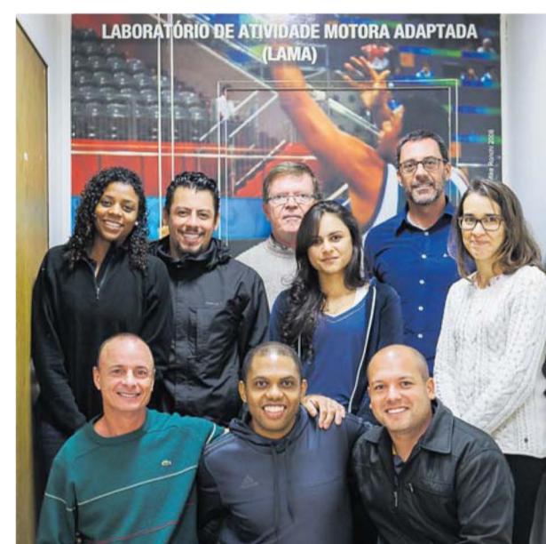
Alunos e professores trabalham em prol do atletismo

Segredos – Uma das estratégias da FEF para descobrir e lapidar novos talentos é acompanhar torneios paralímpicos realizados todos os anos nas cinco regiões brasileiras. Outro trunfo é apostar em diversas modalidades, como, por exemplo, oferecer cursos de extensão universi-